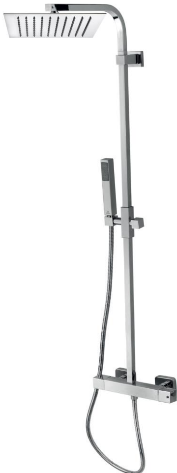
Immagine Prodotto - Product Image

Настенная колонна из латуни сечение 20 x 20 мм - душевая лейка TETIS 300 x 300 мм - ручной душ - держатель для душа фиксированный - гибкий шланг из латуни дв. фальцевания 150 см соединение 1/2" FF - смеситель термостатический